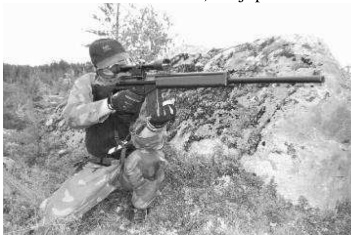
PSG-1 ja vihollinen ristikossa

Airsoft on englanninkielinen nimitys heikkotehoisille ilma-aseille, joilla pelataan viihteellisiä sotapelejä hieman paintballin eli värikuulapelin tapaan. Vakiintunut suomenkielinen nimitys on muovikuula-ase, mutta harrastajat puhuvat usein airsoftista (usein vielä sanan suomalaisittain ääntäen) tai jopa softaamisesta.