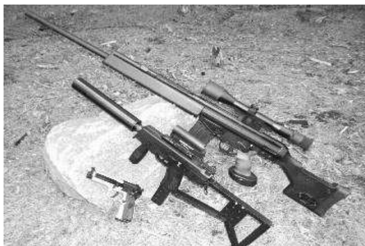
vasemmalta: jousiviritteinen Beretta, kaasutoiminen Steyr TMP ja sähkötoiminen PSG-1

Airsoft-aseet eivät ole missään nimessä tarkoitettu lapsille hernepeppyyksi, sillä niissä on kuitenkin riittävästi voimaa aiheuttamaan vakavankin silmävamman lähietäisyydeltä. Lisäksi mainittakoon, että etenkin kalliimmat mallit ovat erittäin